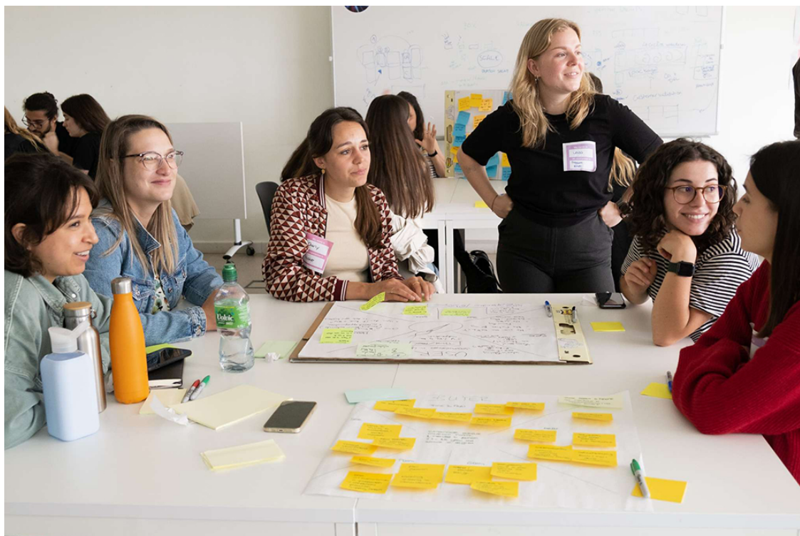
Design Jam for Impact

+info em: https://www.fa.ulisboa.pt/index.php/pt/agenda/noticias-2/item/2812-palestra-a-ceramica-da-fabrica-de-loiça-de-sacavem-no-p