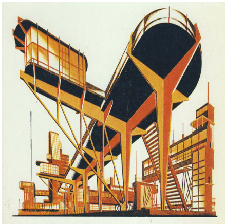
Yakov Chernikhov, Fantasia Arquitectónica, 1933.

Projecto de um edifício efémero na Trafaria