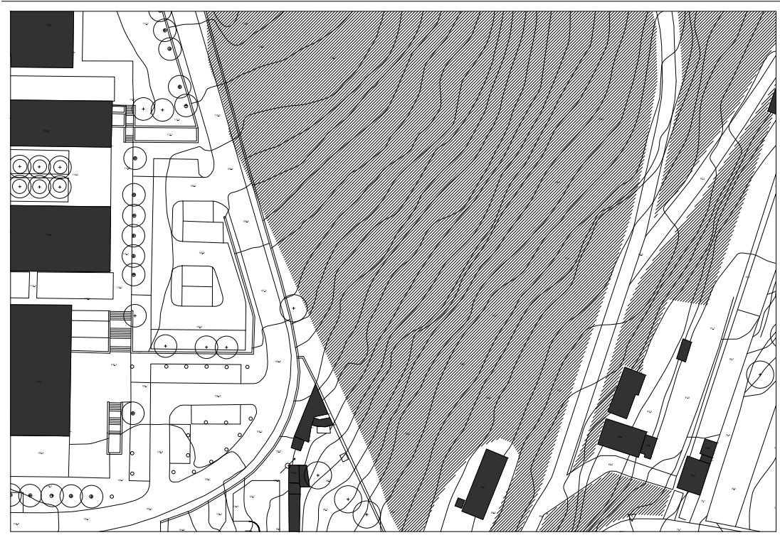
05 Planta de Implantação do lado nascente esc. 1/200