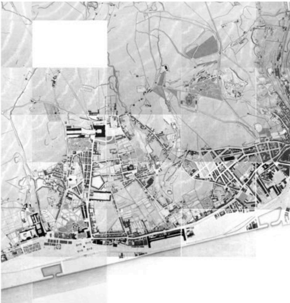
Silva Pinto, Planta de Lisboa . Tapada da Ajuda, 1911.