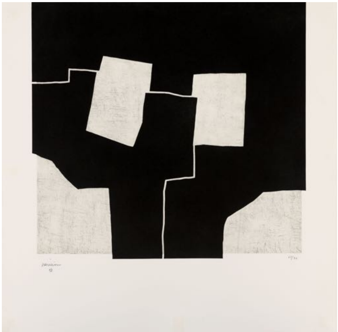
Eduardo Chillida, Urrutiko