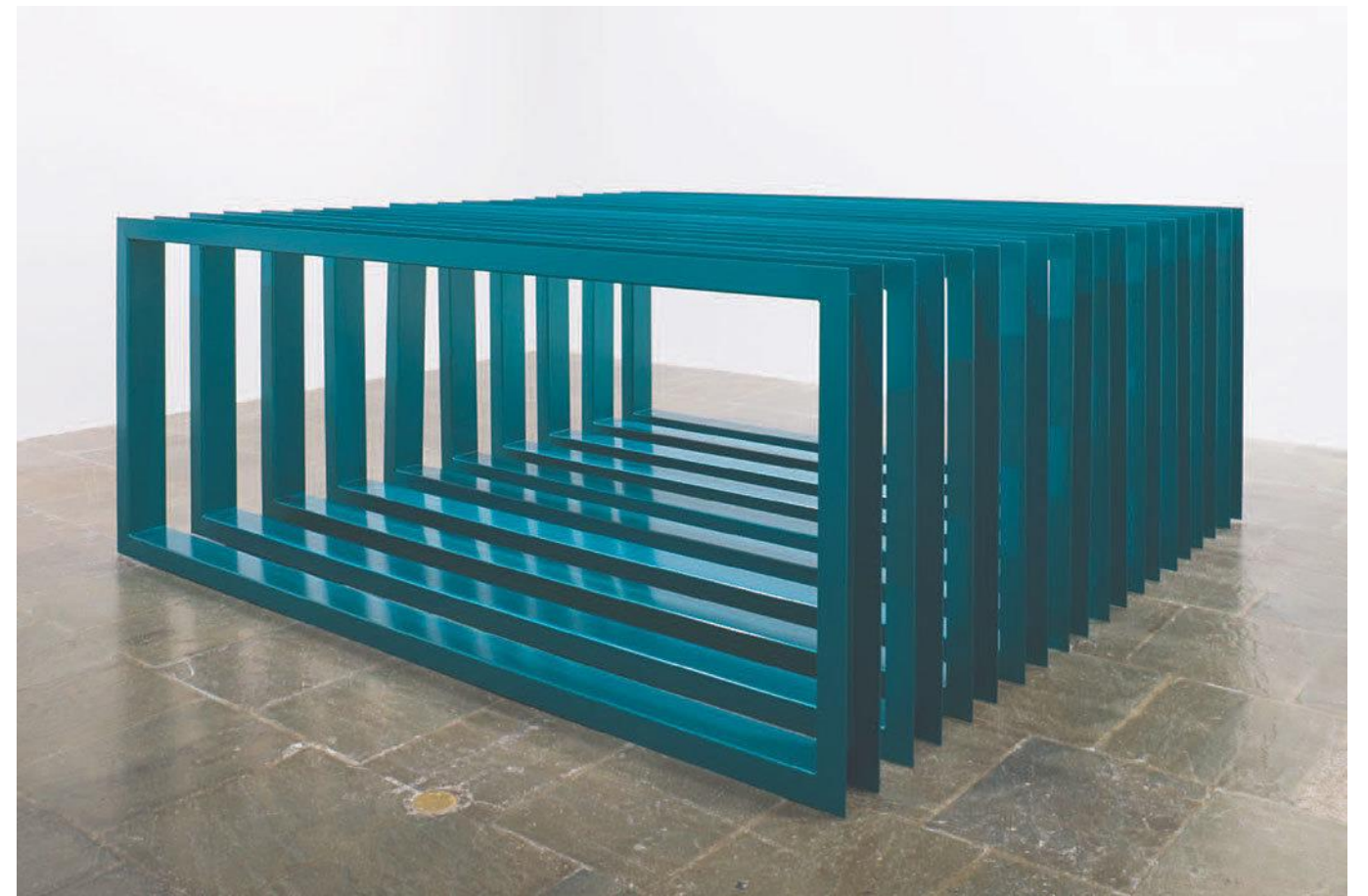
Untitled Donal Judd, 1966

- Gordon Cullen, 1971 in Paisagem Urbana