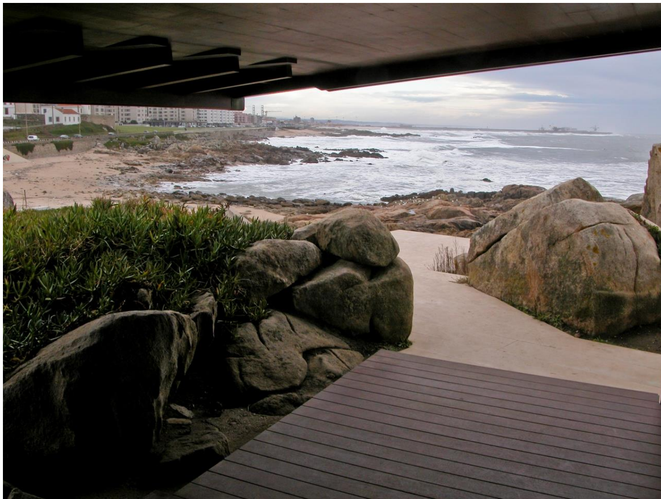
Casa de Chá da Boa Nova, Matosinhos, Porto Álvaro Siza Vieira, 1959 - 1963

“Se estivermos atentos ao detalhe, e habituarmos o olhar a saber ver o pormenor, o mundo construído torna-se mais interessante, e ganha em qualidade”