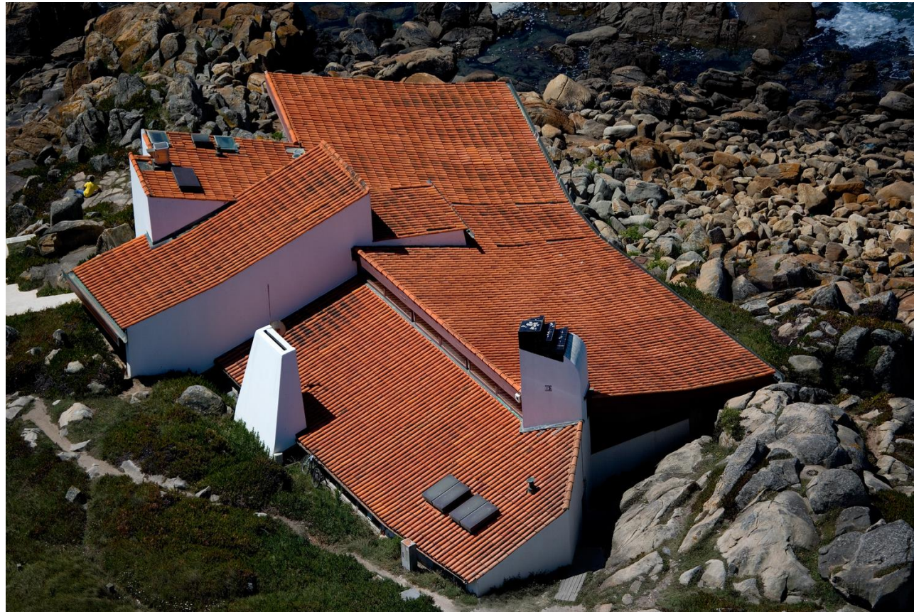
Casa de Chá da Boa Nova, Matosinhos, Porto Álvaro Siza Vieira, 1959 - 1963

- Gordon Cullen, 1971 in Paisagem Urbana