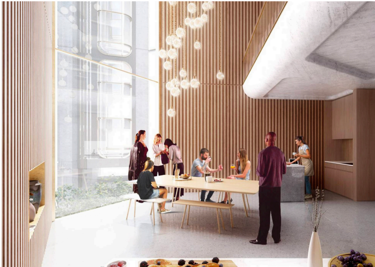
Prototipo del proyecto de Co-living que Foster + Partners ha desarrollado para la ciudad de Qianhai.

Exercício: Calçada da Ajuda- Armazéns no Quartel do Regimento de Lanceiros 2 (Quartel das Guardas de Corpo)