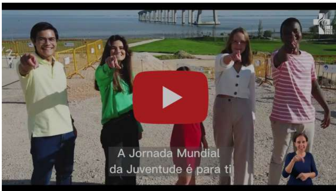
Jornadas Mundiais da Juventude

(REpub) A Jornada Mundial da Juventude está quase a chegar!